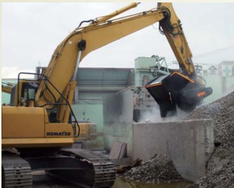
コンクリート廃材